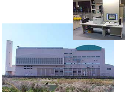
五条川工場中央監視装置更新工事