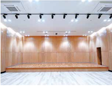
愛知教育大学総合研究棟