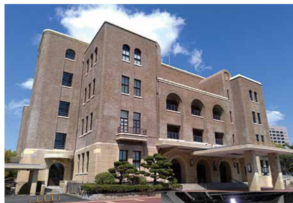
公会堂受変電設備改修工事

安全で、快適な環境整備をはじめ、社会基盤である電気設備を整え、防災・災害復旧対策に貢献しているのが(株)東海電工社です。技術革新にも積極的に取り組み、環境エネルギーやクリーンエネルギーを活かして、新しい技術で人々の生活を豊かにしています。また、高度情報化に伴う通信設備の普及も踏まえ、快適な社会空間を提供しています。