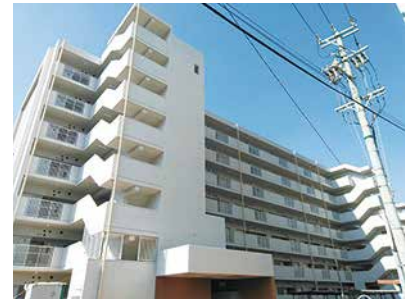
氷室第4次公営住宅電気工事