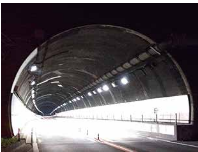
令和2年度静清維持原トンネル坑内