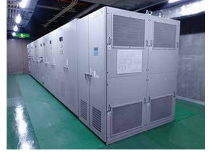
枇杷島スポーツセンター受変電設備取替