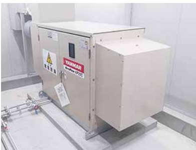
豊田市緊急防災対策河川工事