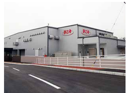
浜乙女三重工場電気設備改修工事