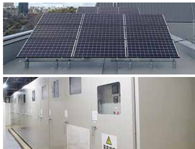
瑞穂公園体育館新築受変電設備工事