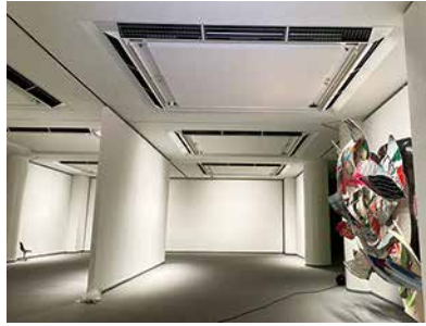
名古屋市美術館照明設備改修