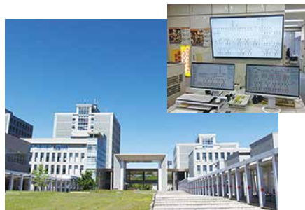
愛知県立大学長久手キャンパス中央監視装置