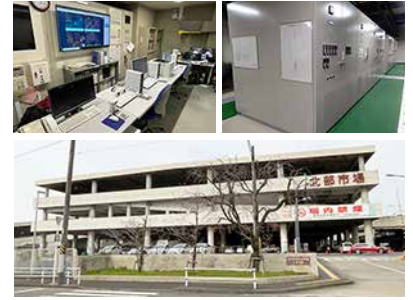
中央卸売市場北部市場