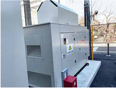
津地方合同庁舎電気設備改修工事