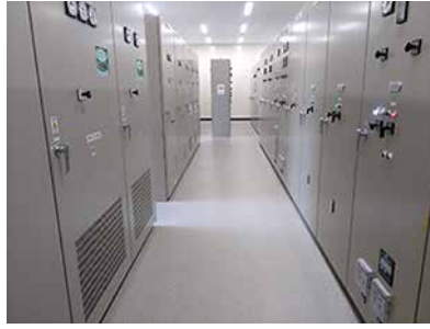
愛岐処分場浸出水処理施設