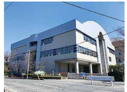
埋蔵文化財調査センター改修電気工事